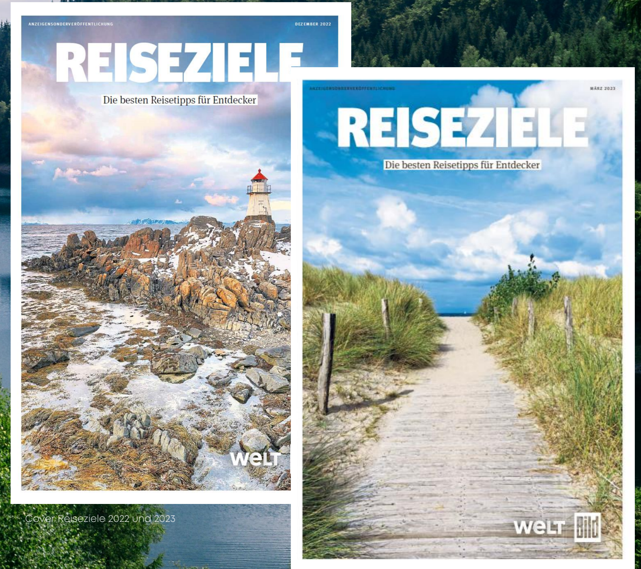
Cover Reiseziele 2022 und 2023

Mit Ihrer Anzeige in diesem Umfeld liefern Sie Inspiration für die Urlaubsplanung!